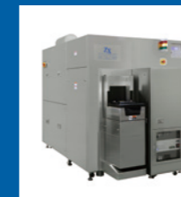
フォトマスク寸法測定装置

フォトマスク上の半導体設計回路寸法測定および欠陥レビュー・分析装置や、半導体製造に不可欠なユニットを提供することで、半導体業界のニーズに応えています。