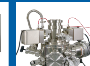
超微細加工・制御