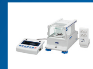
マイクロ(マイクロ)電子天びん