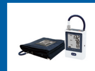
携帯型自動血圧計