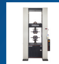
万能試験機 (引張・圧縮試験機)

自然界の情報を捉えるアナログとデジタルの変換技術を原点に、自動車、エネルギーをはじめとする幅広い産業分野に、計測・計量機器を提供しています。