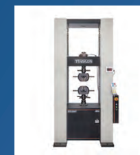
万能試験機 (引張・圧縮試験機)

自然界の情報を捉えるアナログとデジタルの変換技術を原点に、自動車、エネルギーをはじめとする幅広い産業分野に、計測・計量機器を提供しています。