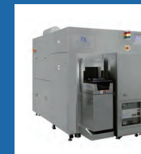
フォトマスク寸法測定装置

フォトマスク上の半導体設計回路寸法測定および欠陥レビュー・分析装置や、半導体製造に不可欠なユニットを提供することで、半導体業界のニーズに応えています。