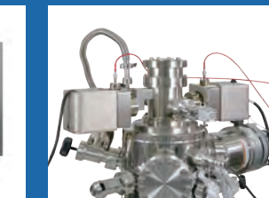
超微細加工・制御