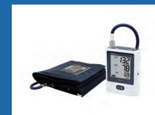
携帯型自動血圧計